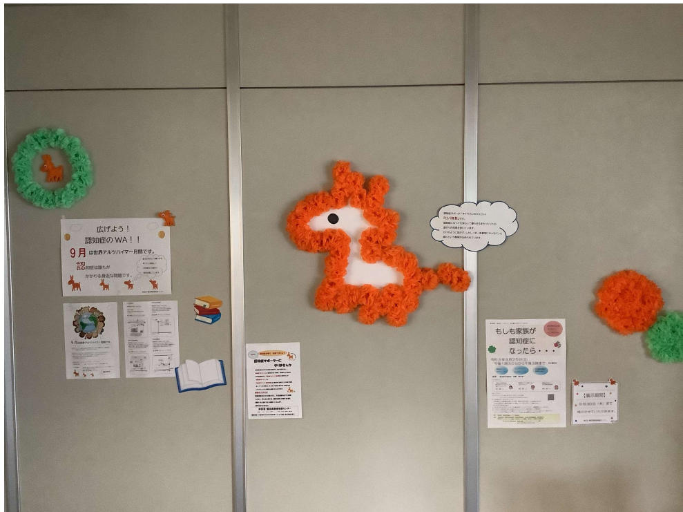
(9月はアルツハイマー月間でした。詳しくは裏面で)