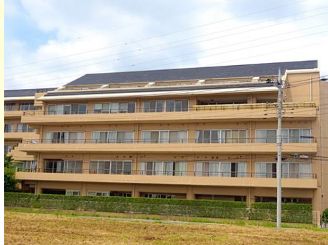
名称：セイワ若松 住所：千葉市若葉区 若松町792-1