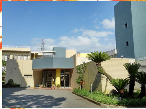
名称：清和園 住所：千葉市若葉区 多部田町1468