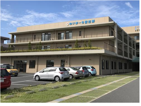
名称：ゆいまーる習志野 住所：習志野市秋津 3-5-1