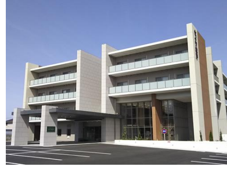
名称：セイワ松戸 住所：松戸市大橋89