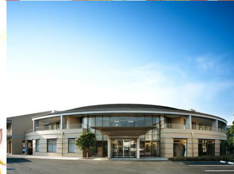
名称：セイワ美浜 住所：千葉市美浜区磯辺 2-21-2