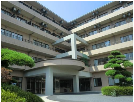
名称：セイワ習志野 住所：習志野市秋津 3-5-3